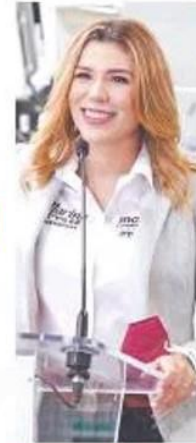
• Marina del Pilar Ávila Olmeda.

● La aspirante a Gobernadora de Baja California por la alianza 'Juntos Hacemos Historia en BC' planteó acciones para 'un verdadero desarrollo social' por medio de la inversión y el empleo. 02